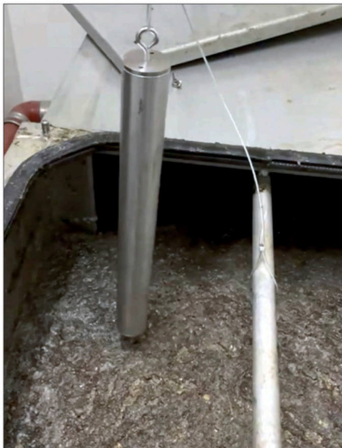
NeoCat Fat III ses her i brug ved tilstoppet fedtbrønde, hvor enheden i løbet af kort tid nedbryder fedtet via den særlige koldforbrændingsproces.

"Ofte kommer vi først på banen, når udfordringerne hos virksomhederne er blevet uoverstigelige. Det kan være ved fedtbrønde og tilknyttede rør, hvor man er kørt sur i at slamsugeren hele